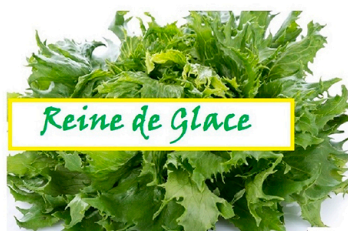
Reine de Glace