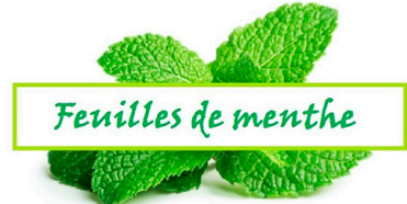
Feuilles de menthe