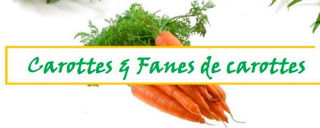
Carottes & Fanes de carottes