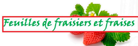
Feuilles de fraisières et fraises