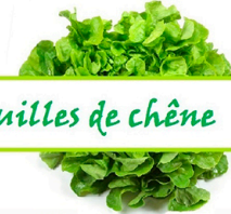
Feuilles de chêne