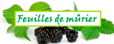
Feuilles de mûrier