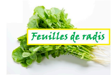
Feuilles de radis