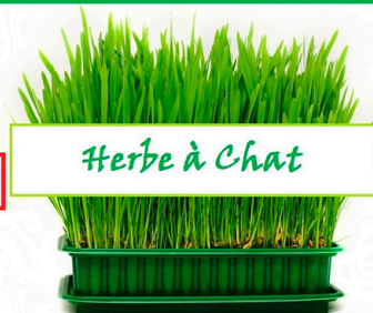
Herbe à Chat